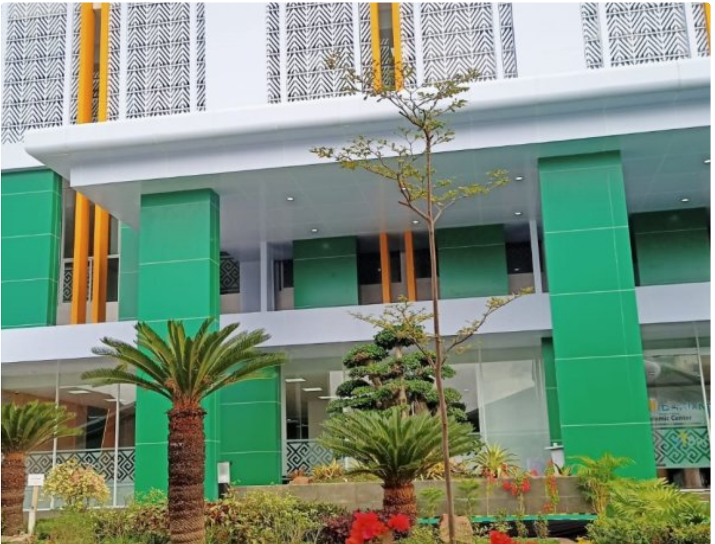
Gedung Baru Kantor Pusat Bank NTB Syariah.

Mataram NTB - Gubernur NTB Dr. H. Zulkieflimansyah berharap dengan rampungnya pembangunan gedung baru Bank NTB Syariah dapat menjadi inspirasi bagi masyarakat dalam mendukung pembangunan dan perekonomian